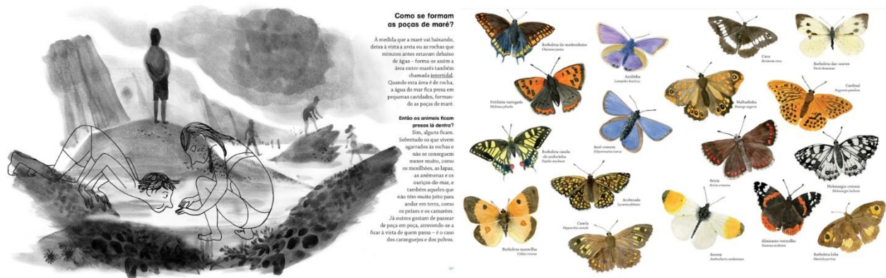
Figura 2 Exemplo de ilustração artística (esquerda) e científica (direita), ambas presentes no Guia.

Internacional do livro infantil de Bolonha em 2015, e sendo aconselhado pelo Plano Nacional de Leitura.