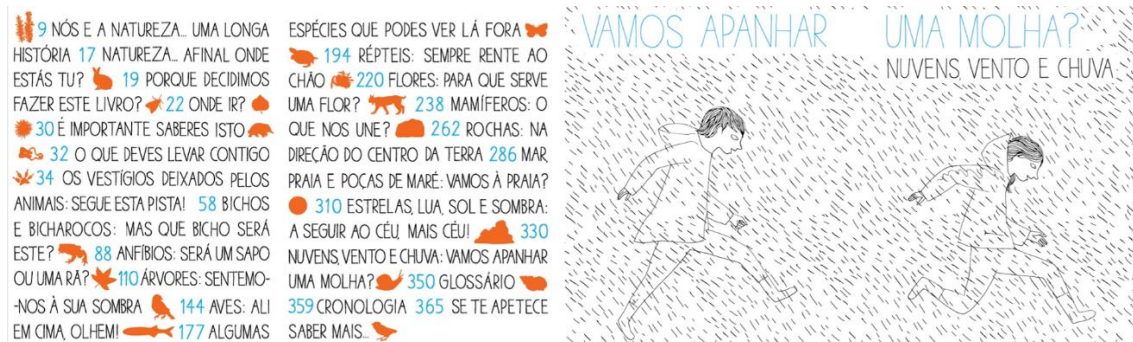
Figura 3 Índice, com os diferentes conteúdos, e dupla página de abertura de conteúdo.

Em contexto escolar, este livro torna-se uma provocação: desafiando a escola a explorar o mundo natural. Por fundir com maestria diversas áreas de conhecimento, pode, inclusivamente, apoiar trabalho por projetos e facilitar a flexibilidade curricular. Pode também ser levado na mochila e nada impede de que seja aberto em qualquer lugar: seja ele no meio de uma floresta selvagem, de um jardim urbano, da varanda ou até numa paragem de autocarro.